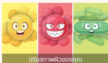
ปรับสภาพผิวของคุณ

ปรับสภาพผิวของคุณในขณะที่มีการรักษาสมดุลของแบคทีเรียในผิว ส่วนผสมพรีไบโอติก (Oligosaccharides, Fermented lactic acid bacteria extract) จะช่วยลดความเสี่ยงแบคทีเรียที่ก่อให้เกิดสิว ช่วยปกป้องผิวจากสภาวะผิวหนังได้อย่างทั่วถึงพร้อมรักษาสมดุลของแบคทีเรียในผิว ผลิตภัณฑ์นี้จะช่วยให้ผิวของคุณนุ่มชุ่มชื้น